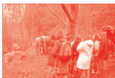
Un lieu de découverte et de partage