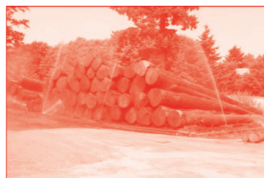
Une activité économique importante