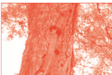
Un milieu très riche en biodiversité