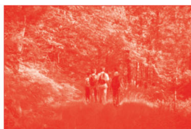
De grandes possibilités de loisirs