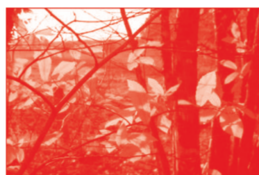
Une essence phare : le châtaignier