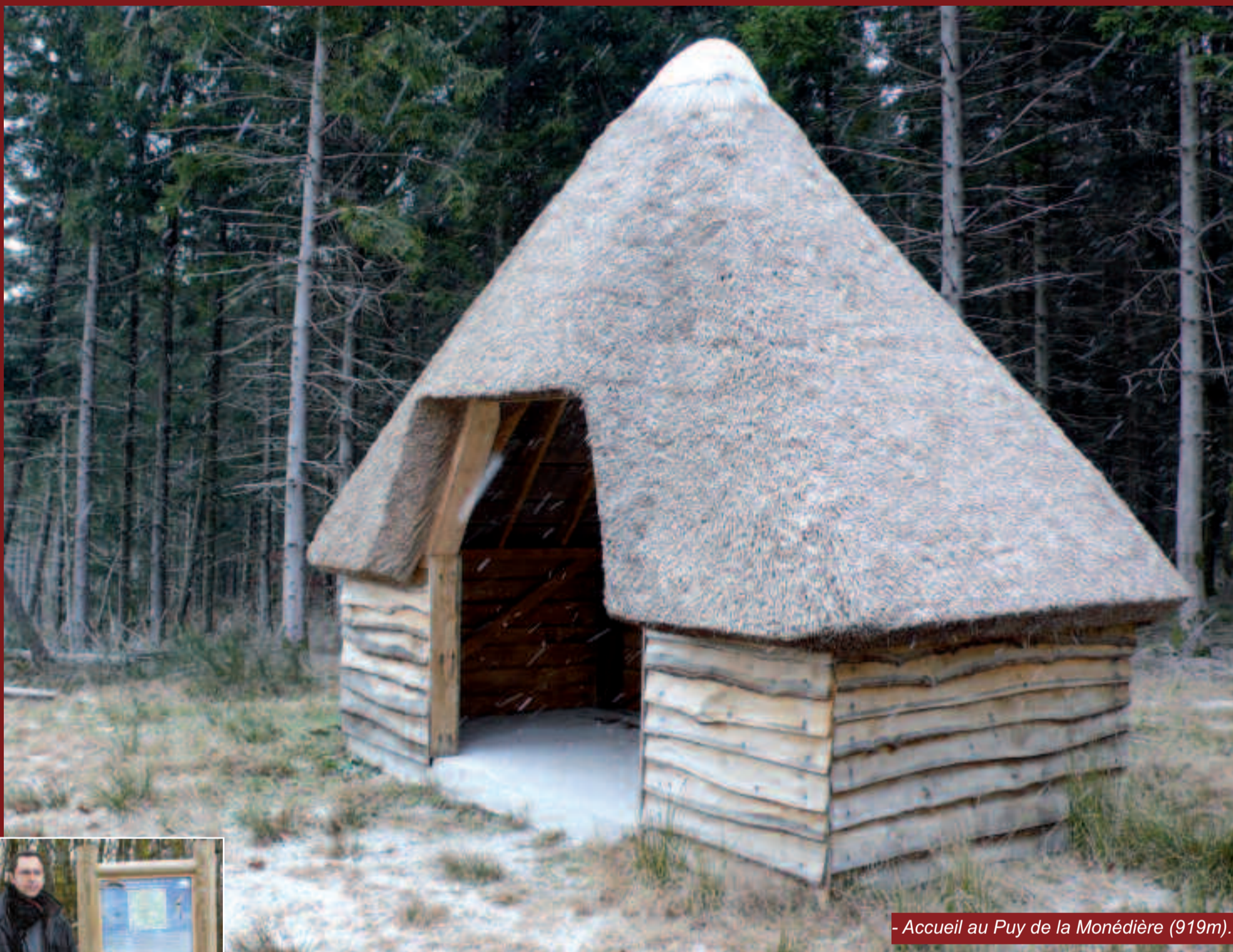
- Accueil au Puy de la Monédière (919m).