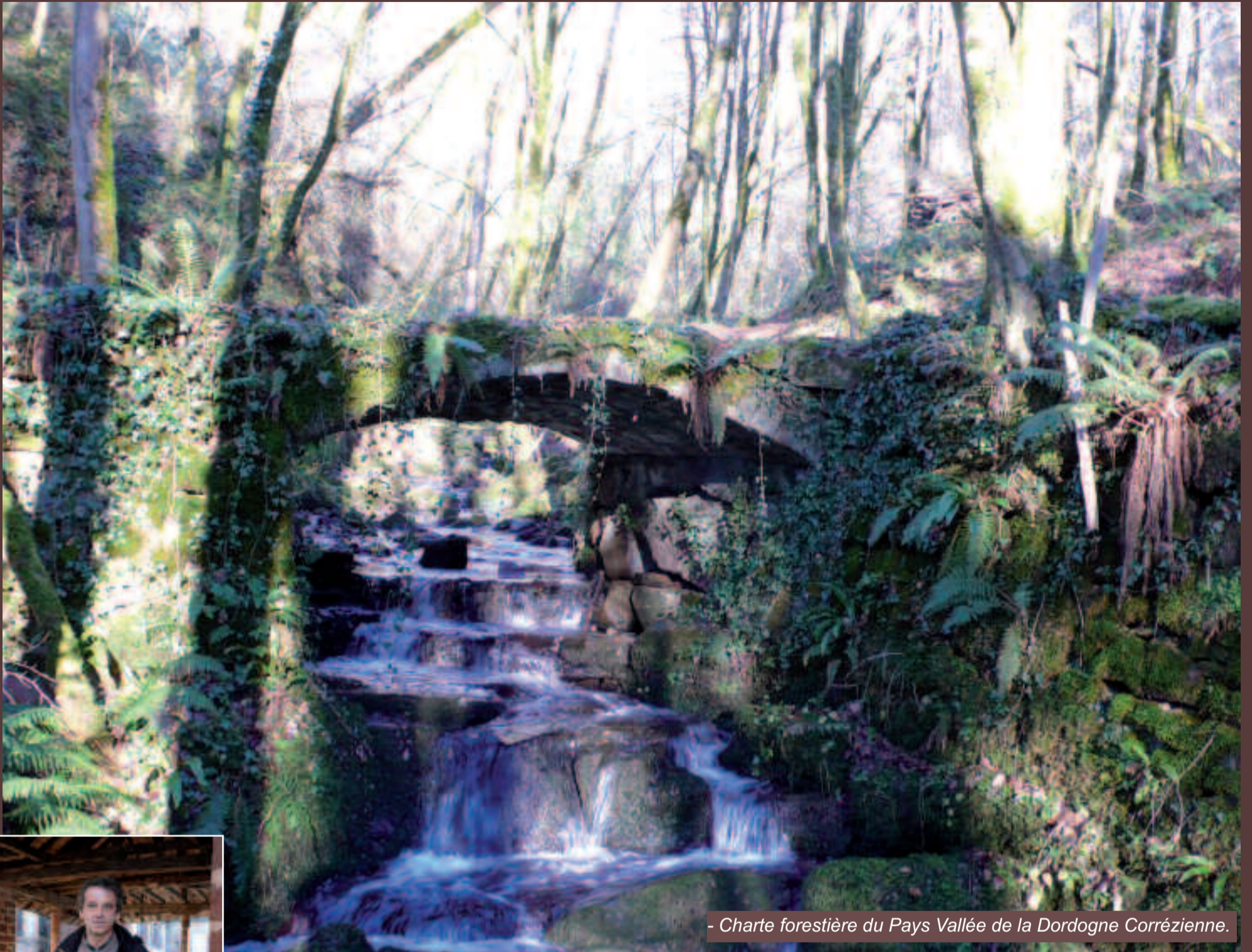
- Charte forestière du Pays Vallée de la Dordogne Corrézienne.