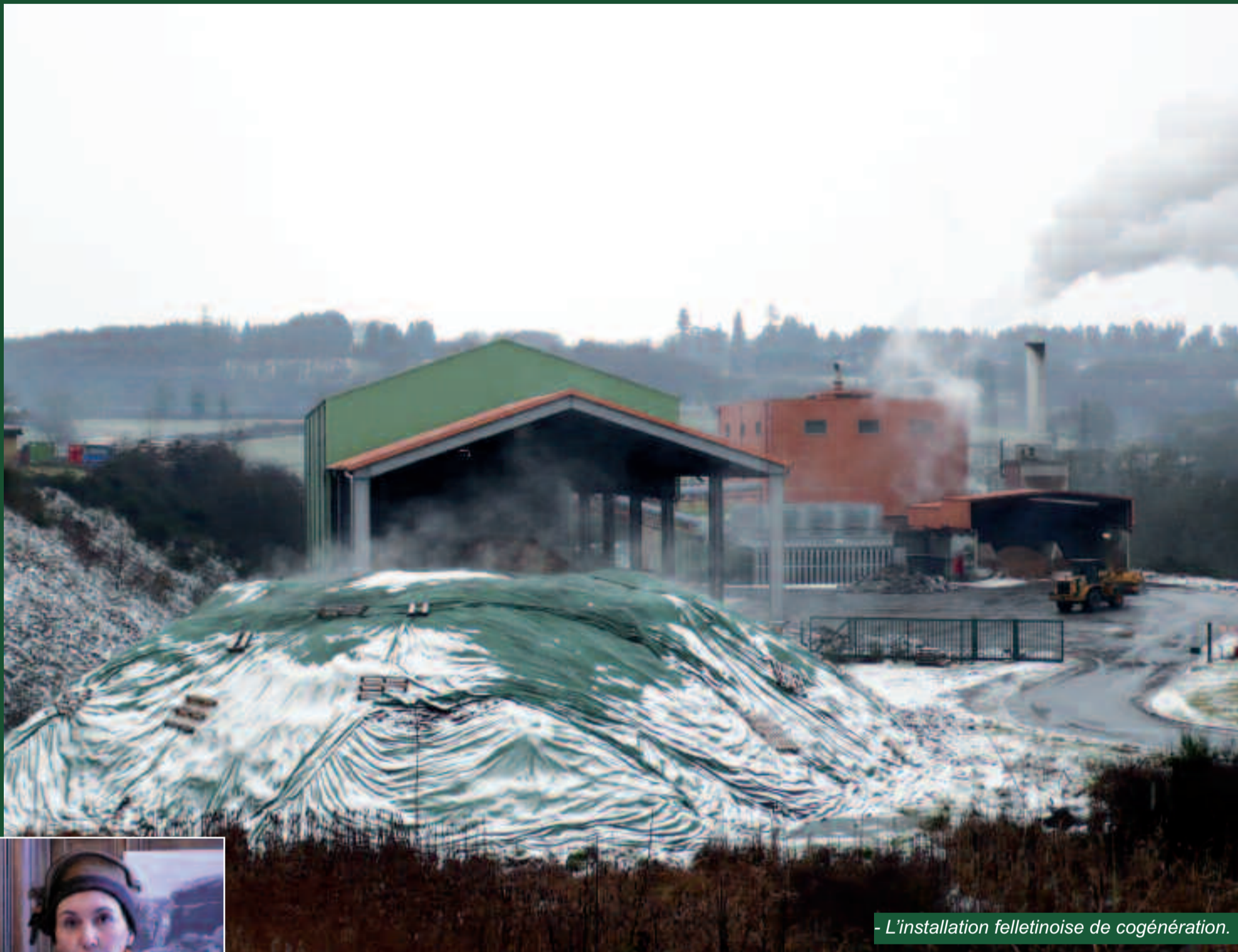
- L'installation felletinoise de cogénération.

LA FILIÈRE BOIS LIMOUSINE C'EST : DE L'ÉNERGIE À VALORISER