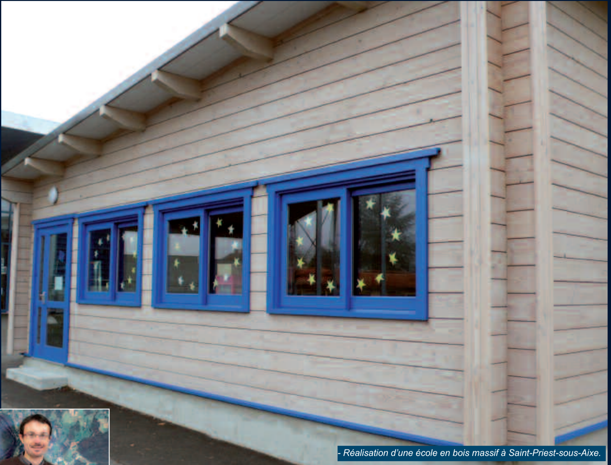
- Réalisation d'une école en bois massif à Saint-Priest-sous-Aixe.