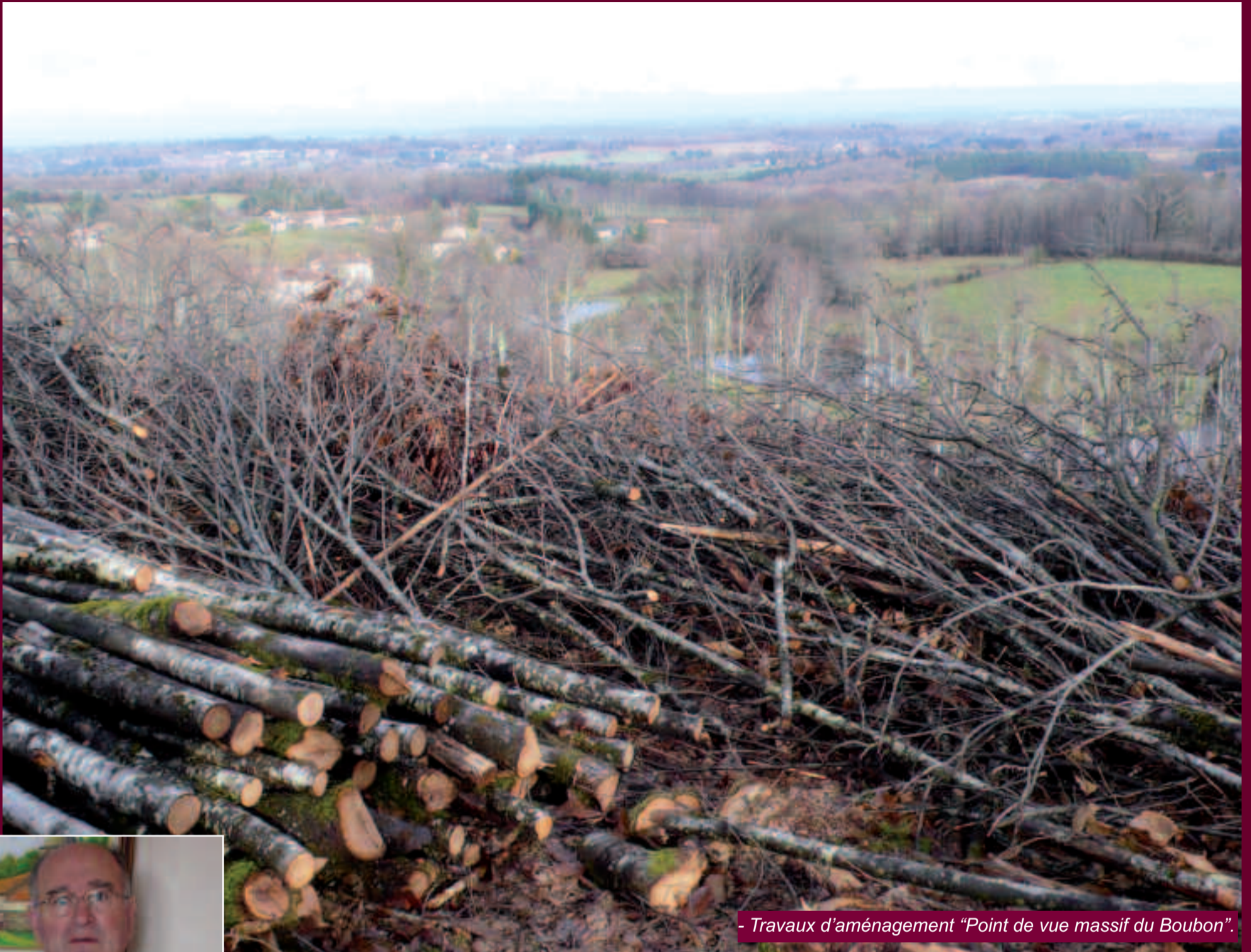
- Travaux d'aménagement "Point de vue massif du Boubon".