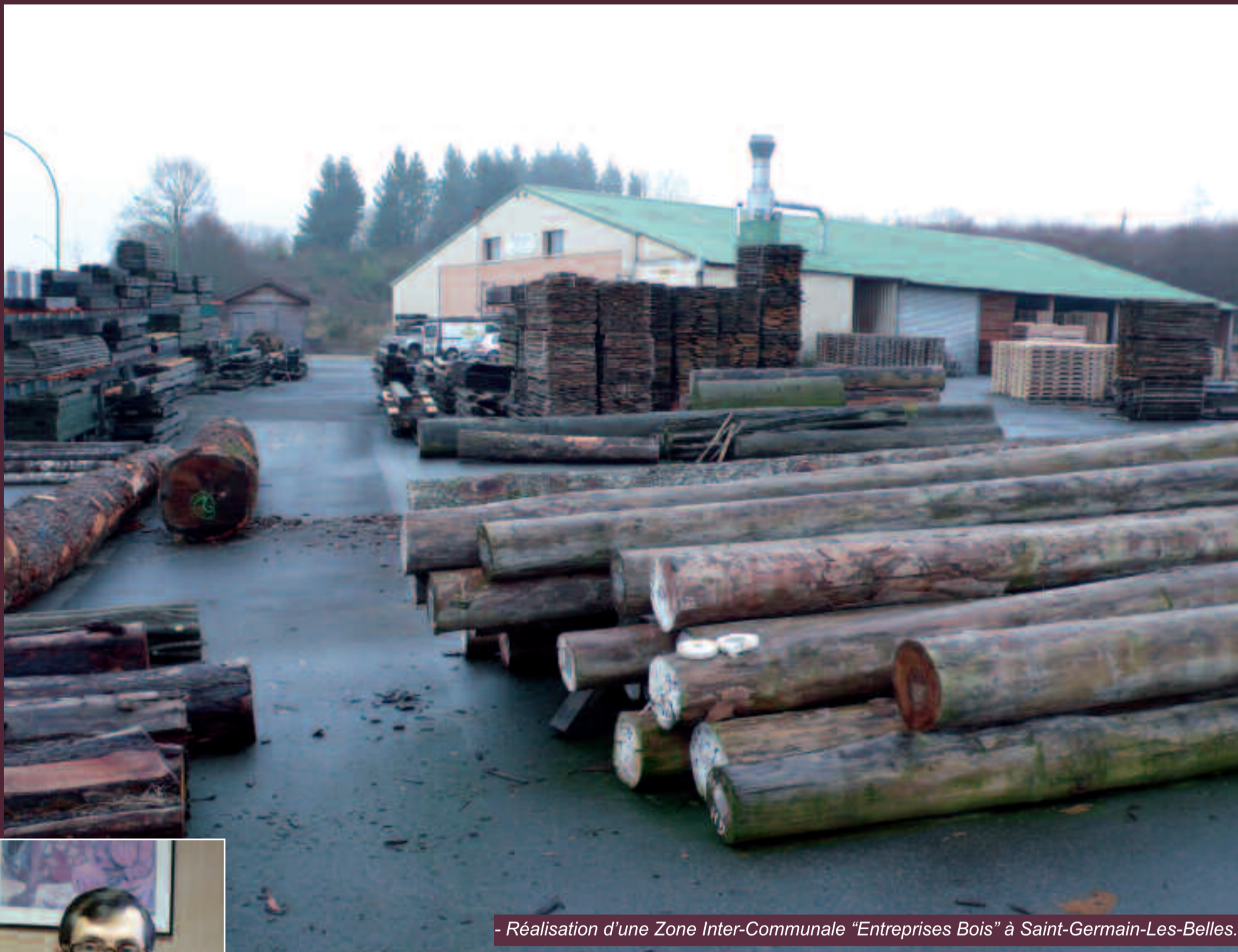
- Réalisation d'une Zone Inter-Communale "Entreprises Bois" à Saint-Germain-Les-Belles.