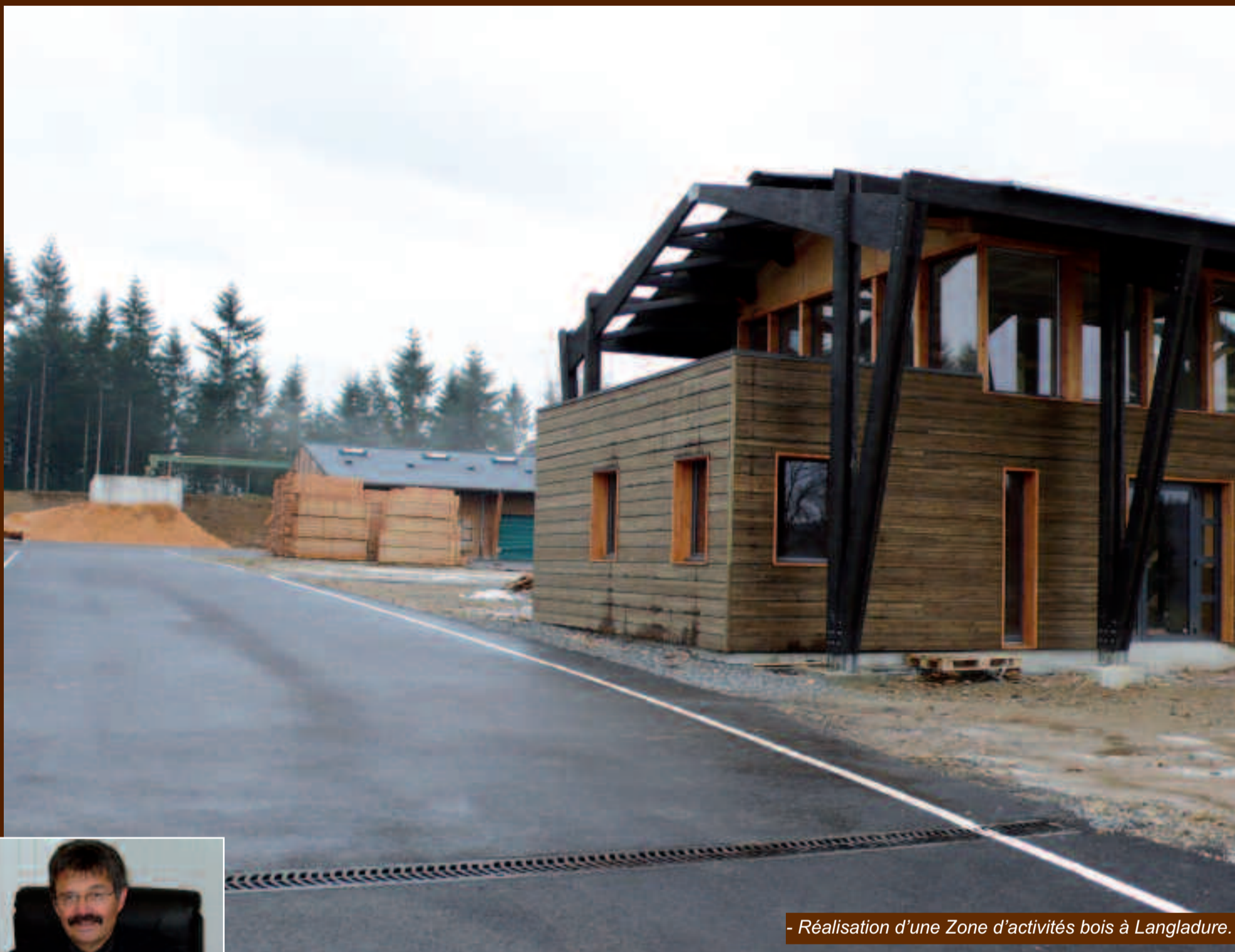
- Réalisation d'une Zone d'activités bois à Langladure.