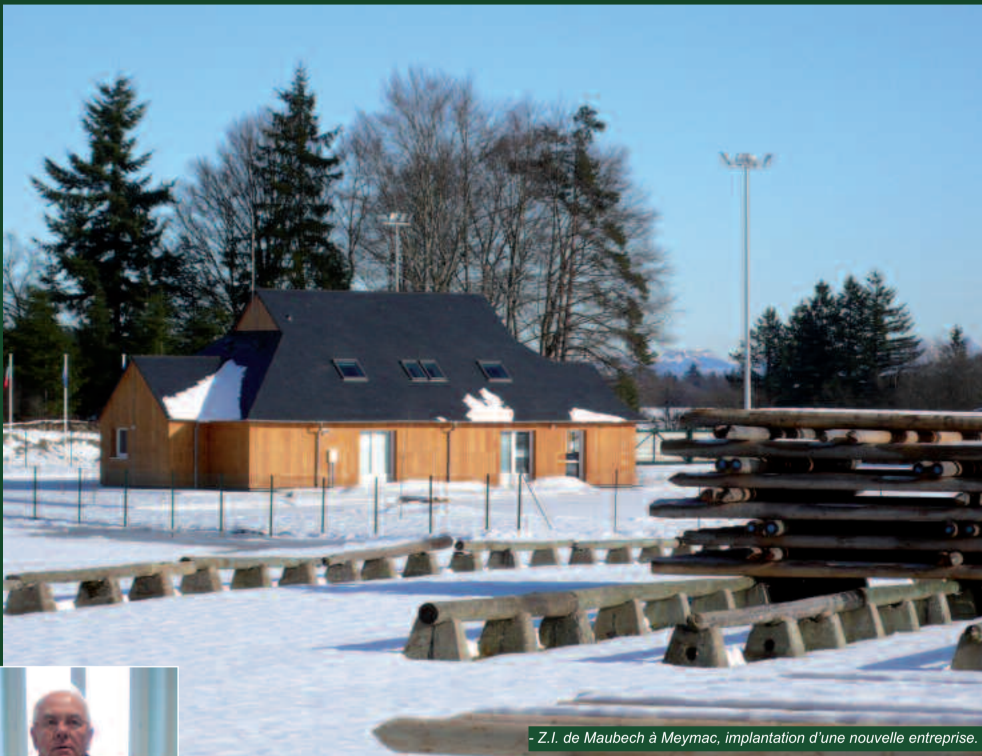
- Z.I. de Maubech à Meymac, implantation d'une nouvelle entreprise.