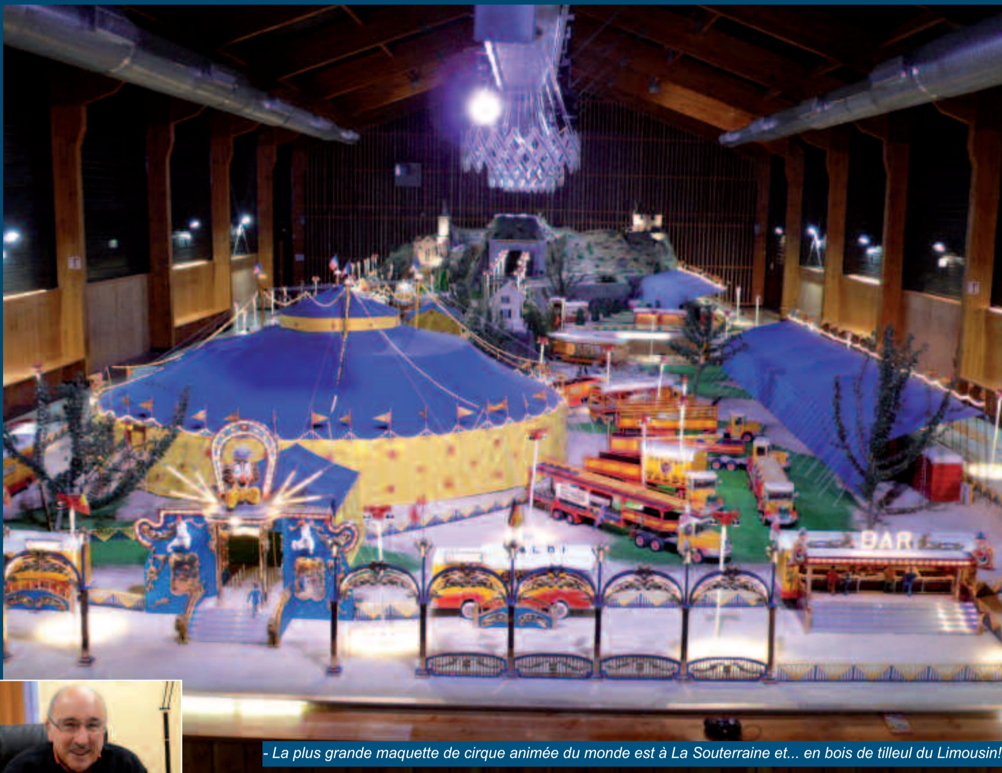
- La plus grande maquette de cirque animée du monde est à La Souterraine et... en bois de tilleul du Limousin!