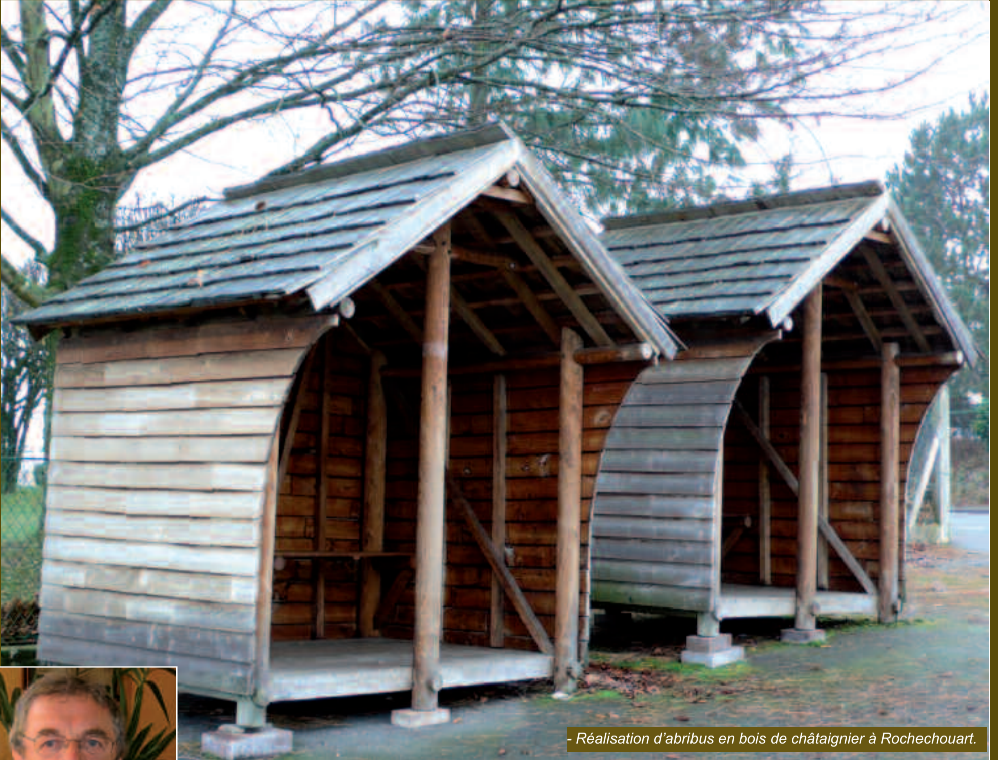
- Réalisation d'abribus en bois de châtaignier à Rochechouart.