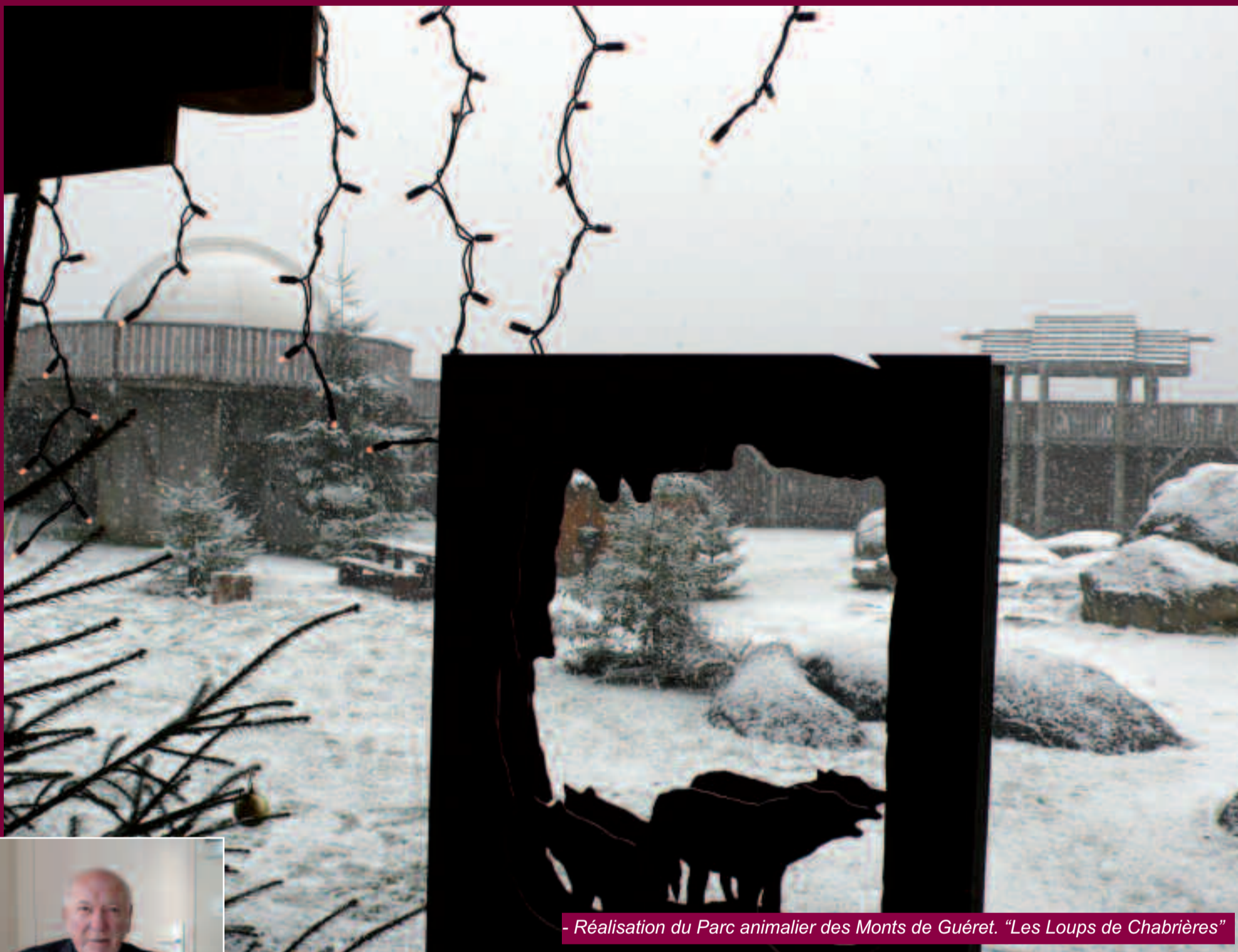
- Réalisation du Parc animalier des Monts de Guéret. "Les Loups de Chabrières"