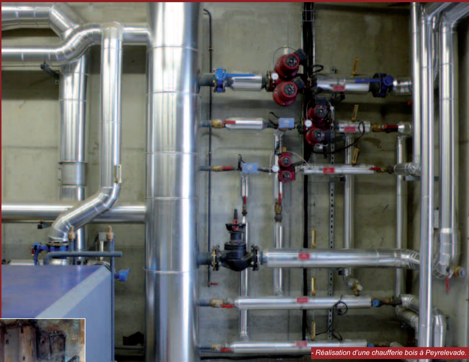
- Réalisation d'une chaufferie bois à Peyrelevade.